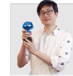
巨浪 NIO蔚来汽车 Lead Designer